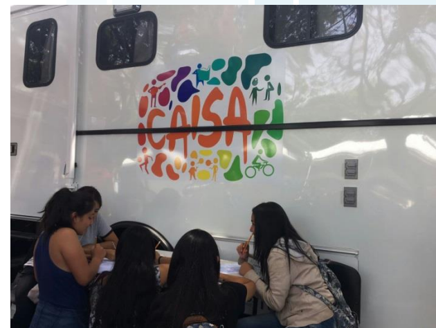
Adolescentes en el municipio de Cuautla contestando la herramienta de detección de riesgo .